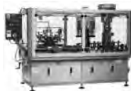
vystřikovací, plnicí a zátkovací triblok